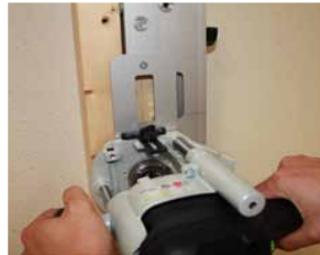
Afb. 13 Uittrezen dag- en nachtgedeelte