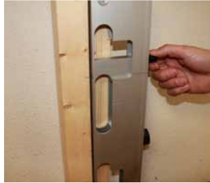
Afb. 23 Aanslagblok naar beneden