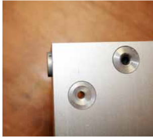
Afb. 16 Stelplaatjes 3 mm uitzetten