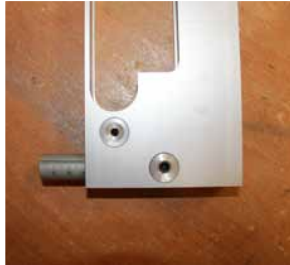
Afb. 3 Stelvoetjes instellen