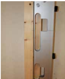
Afb. 18 Minimal in kozijn