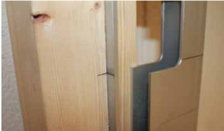
Afb. 8 Graveerlijn gelijk zetten