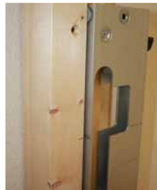
Afb. 20 Graveerlijn gelijk zetten