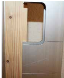
Afb. 19 Graveerlijn Minimal