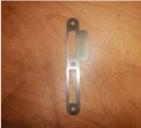
Afb. 2 Vlakke Sluitplaat