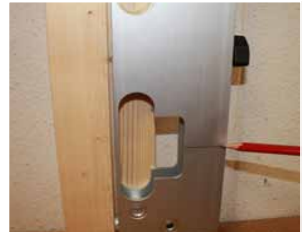
Afb. 14 Afschrijven hart Sluitplaat