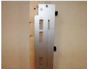
Afb. 12 Inlegplaat in Minimal