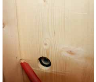
Afb. 17 Afschrijven kruk gat