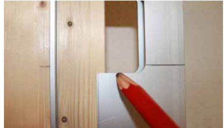
Afb. 9 Onderkant uitsparing