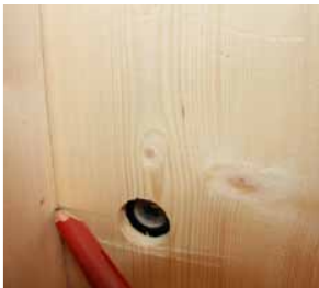
Afb. 5 Afschrijving kruk gat