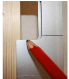
Afb. 21 Onderkant uitsparing