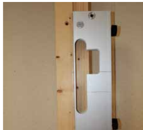
Afb. 6 Minimal in kozijn