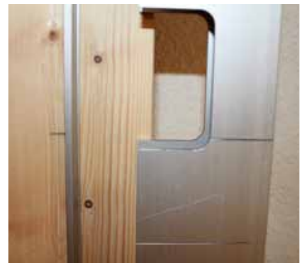
Afb. 7 Graveerlijn