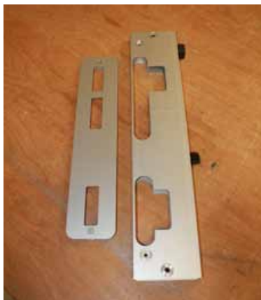
Afb. 1 Minimal en inlegplaat