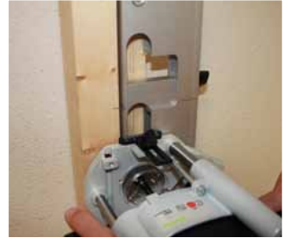
Afb. 24 Uitrezen sluitkom