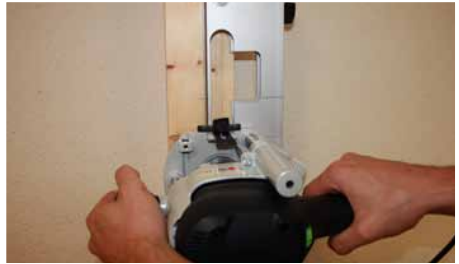
Afb. 11 Uittrezen buitencontour