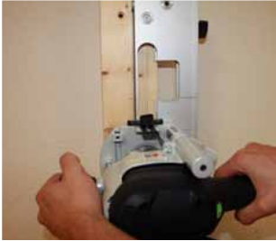
Afb. 22 Uitrezen buitencontour