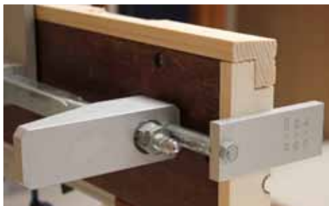
Afb. 3 Afschrijfmal gepositioneerd tegen de deur