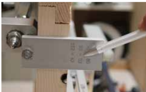
Afb. 4 Instellen/controlen maten