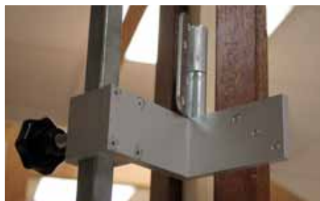
Afb. 2 Aanslag tegen onderzijde scharnierblad