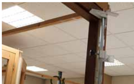
Afb. 1 Afschrijfmal gepositioneerd in het kozijn

Let op! Plaats de aanslag niet tegen de onderkant van het Scharnierdopje.