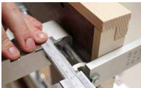
Afb. 5 Instellen/controlen maten