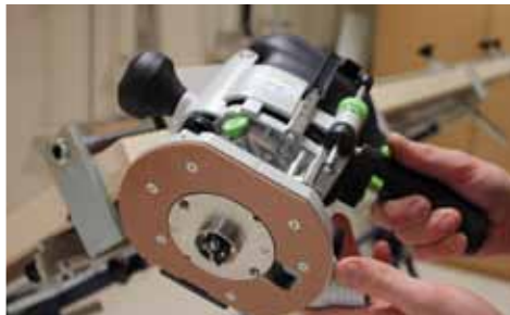
Afb. 7 Freesmachine, geleidering en beitel