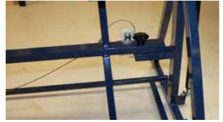
Afb. 6 Sterknop volledig vast