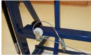
Afb. 11 Verbinden kabels