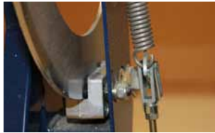
Afb. 14 Eindpositie remschaar