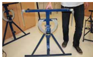
Afb. 3 Zijkant