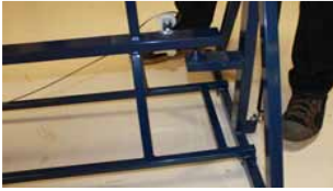
Afb. 4 Basisframe over zijkant