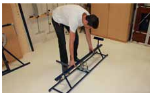
Afb. 2 Basisframe