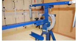
Afb. 9 Vastzetten koppelstang