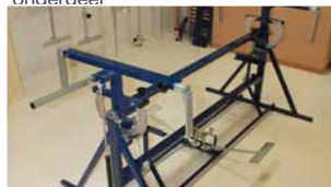
Afb. 20 Eindresultaat