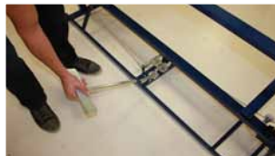
Afb. 17 Plaatsen laatste onderdeel