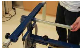
Afb. 15 Plaatsen laatste onderdeel