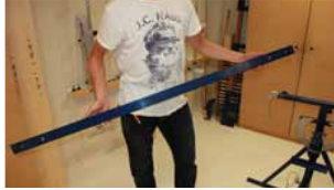
Afb. 8 Koppelstang