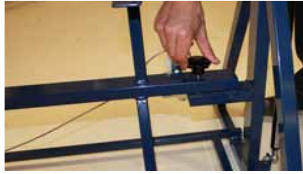
Afb. 5 Vatzetten met sterknop