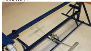
Afb. 19 Plaatsen laatste onderdeel