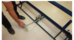
Afb. 18 Plaatsen laatste onderdeel