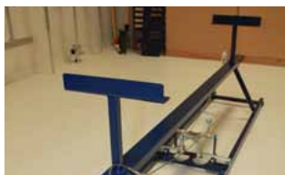
Afb. 1 Basisframe