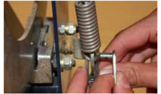
Afb. 12 Verbinden remschaar