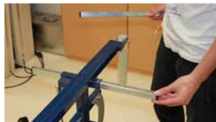
Afb. 16 Plaatsen laatste onderdeel