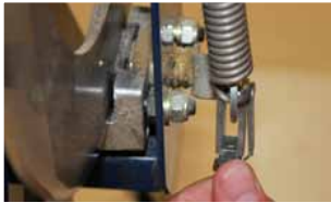
Afb. 13 Verbinden remschaar