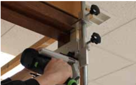
Afb. 13 Uitzrezan scharnieren