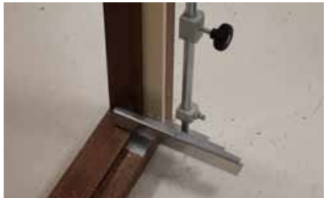
Afb. 8 Kopieerstang uit blokkeerstand