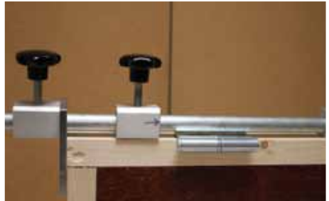
Afb. 4 Bovenplaat (T-vorm) bovenzijde raam