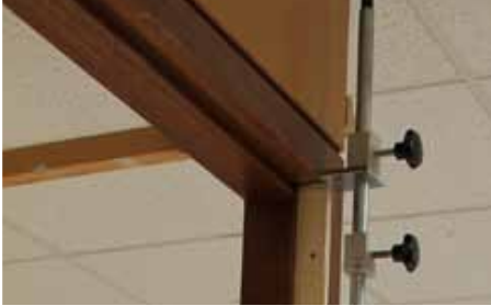
Afb. 9 Kopieerstang gepositioneerd in het kozijn