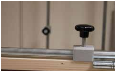
Afb. 7 Aanslag tegen bovenzijde Scharnierblad