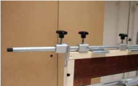
Afb. 5 Bovenplaat (T-vorm) bovenzijde raam