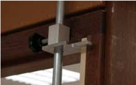
Afb. 3 Kopieerstang gepositioneerd in kozijn