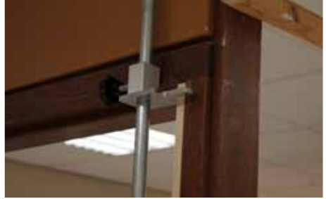
Afb. 2 Kopieerstang gepositioneerd in kozijn