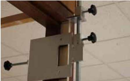
Afb. 11 Scharnierfreesmal tegen onderzijde aanslag