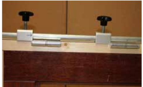
Afb. 6 Aanslag tegen bovenzijde Scharnierblad