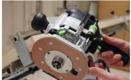
Afb. 12 Freesmachine, geleidering en beitel